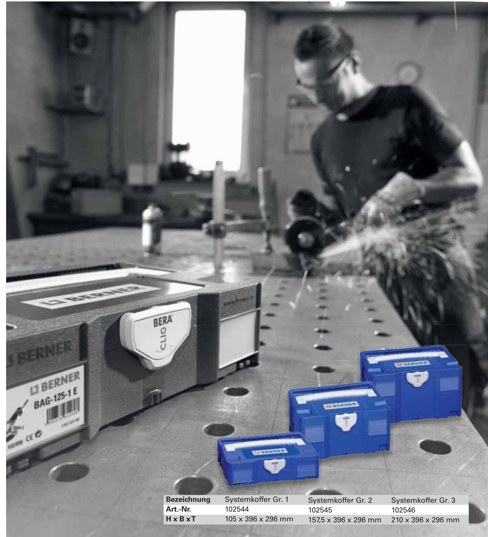
Koffer lassen sich auch in verknicktem Zustand öffnen