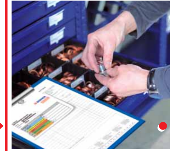
Einfache Dokumentation der Entnahme von C-Teilen anhand von Farbton oder Buchstabe