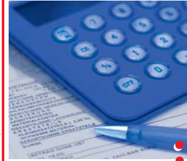
Rechnungsstellung an Kunden mit der Weiterberechnung von C-Teilen