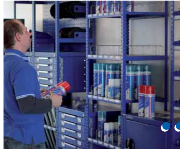
Bera-Modul Regal mit bedarfsgerechter Bestückung

Sie verschenken keine C-Teile und steigern zusätzlich Ihren Gewinn