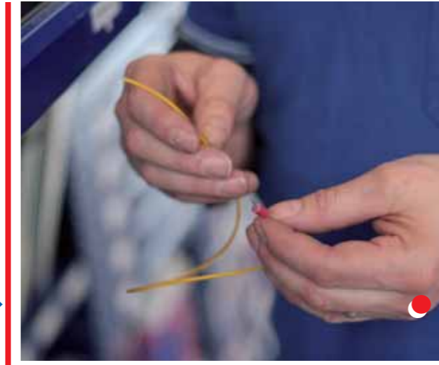
Entnahme und Verbrauch von C-Teilen aus dem Bera-Modul Regal