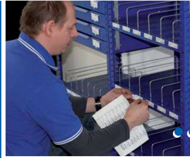
Berner Fachberater bringt neue produktbereichsgerechte Etiketten an das Bera-Modul Regal an